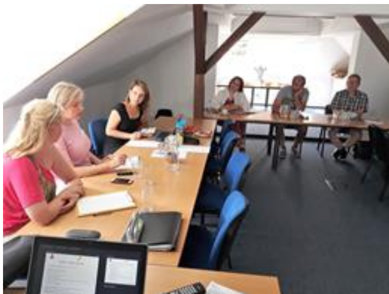
Na Václavce, ustavující jednání