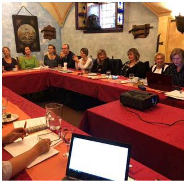
Kampa, členská základna